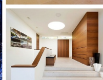
Neubau Einfamilienhaus, Zürichsee Baujahr: 2012 Bauherrschaft: privat