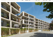
Zentrumsüberbauung Linthofwiese, Uznach SG Baujahr: 2010–2012 Bauherrschaft: Pensionskasse des Bundes Informationen: Neubau mit 106 Wohnungen (davon 35 Alterswohnungen) und 1500 m 2 Gewerbe