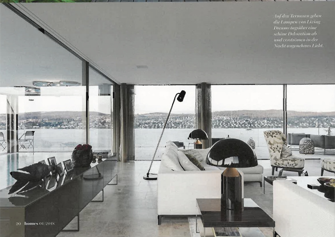
Auf den Terrassen gehen die Lampen von Living Dreams tagüber eine schöne Dekoration ab und verströmen in der Nacht angenehmes Licht.