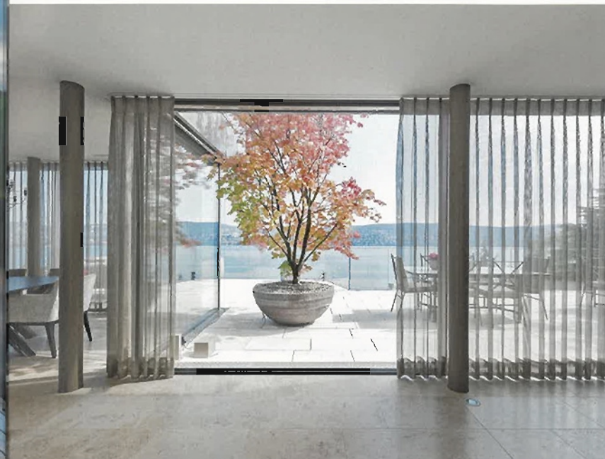
Die Vorhänge filtern das grelle Tageslicht, ohne den Ausblick auf den Solitärbaum und den See zu beeinträchtigen. Dank den rahmenlosen Schiebetüren verschimmen die Grenzen zwischen drinnen und draussen.