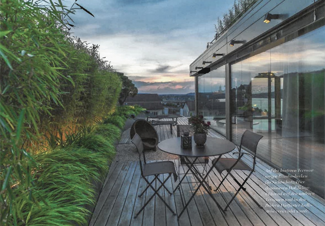
Auf der hinteren Terrasse sorgen Bambushecken für Sichtschutz. Hier dominieren Holzbeläge, während auf den anderen Terrassen und in den Boden Dielen, die kalt ausstrahlen, zu finden sind.